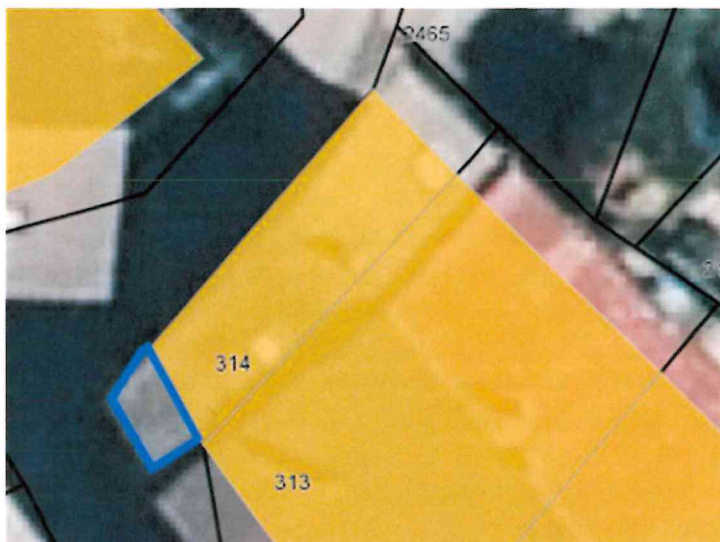
* Portion de voirie cédée